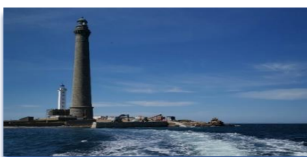
Phare de l'Île Vierge

Site de l'Office de tourisme du Pays des Abers : https://www.akers-tourisme.com/