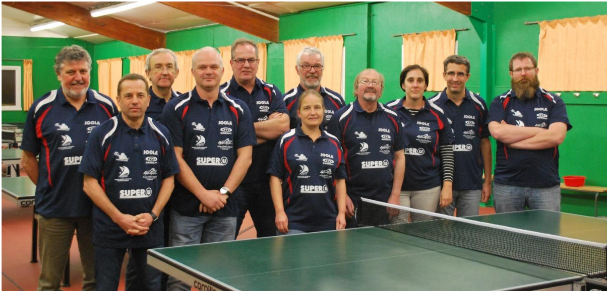
L'équipe organisatrice du Pongiste Club Plabennec