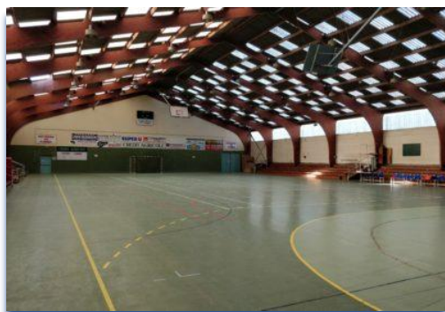
Intérieur de l'espace Kervéguen