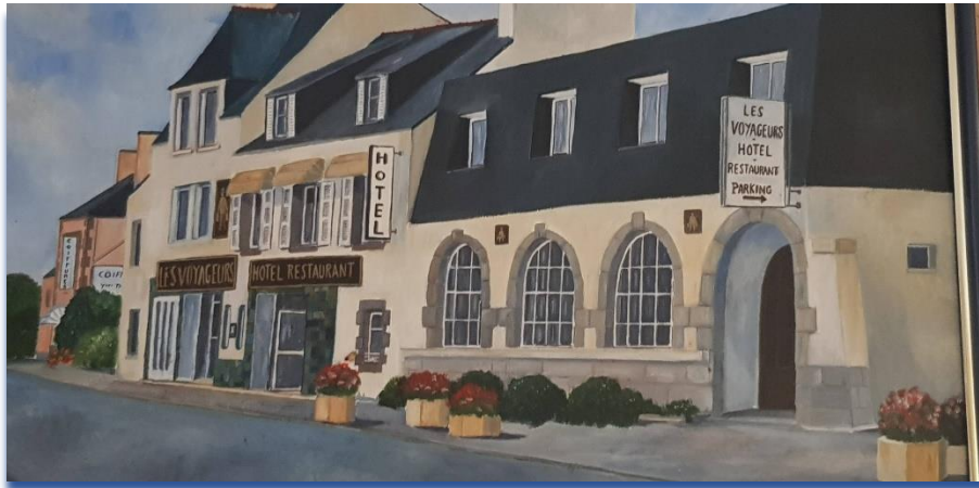
Peinture de Daniel Alliard

Nous proposons de réserver des paniers repas à retirer au moment de votre retour du dimanche soir, pour le tarif de 6 €. Tout au long des deux jours de la compétition, une buvette sera à votre disposition avec boissons fraîches et chaudes, ainsi qu'un service de crêpes fraîches.