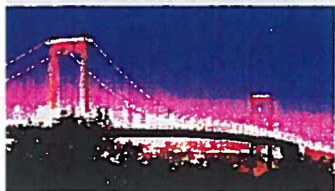
LE PONT D'AQUITAINE