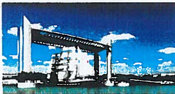
LE PONT CHABAN-DELMAS