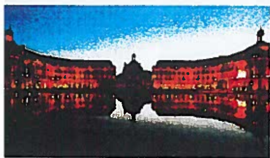
LE MIROIR D'EAU